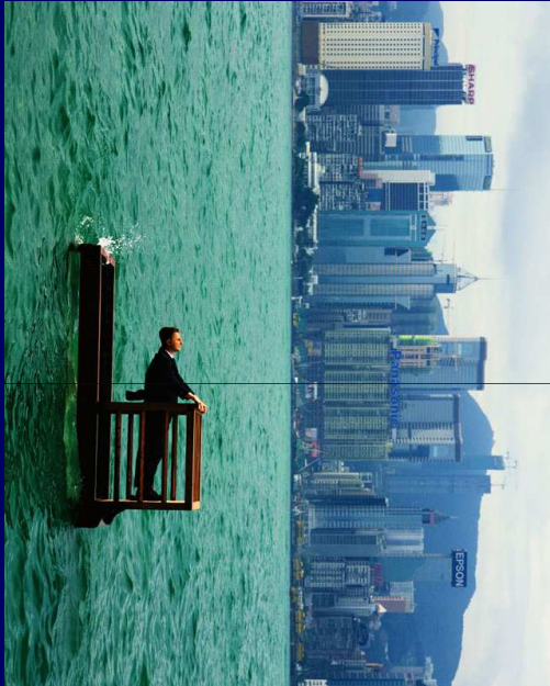
Philippe Ramette, Balcon 2 (Hong-Kong), 2001